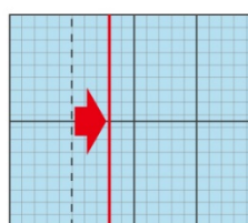
リニアリティ補正